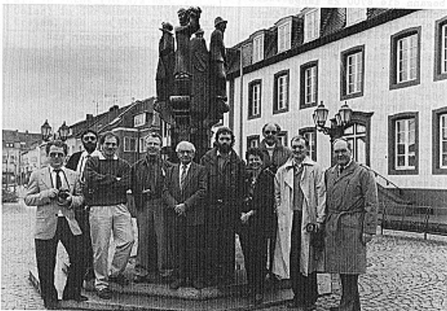
Fotoclub Saarwellingen e.V.