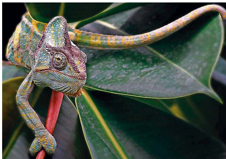
Mit „Jemenchamäleon“ machte Klaus Peter Selzer seinen ersten Platz in Dubai.